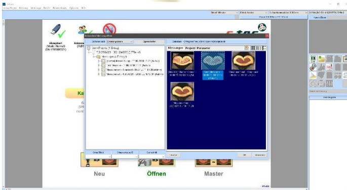
Datenbankgestütztes Speichersystem inkl. Diabild-Funktion