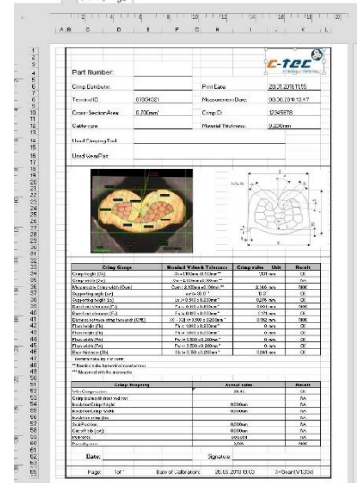
Beispiel: Crimp-Report in Excel