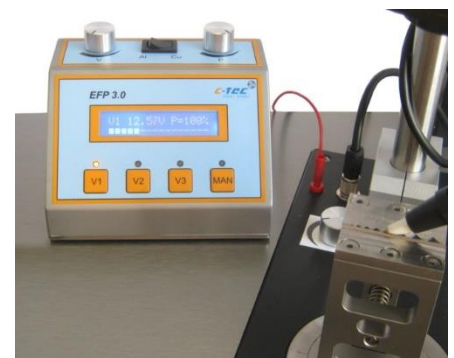
Elektronisches Feinpolieren eines Crimpschliffes