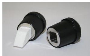
Polierspitzen und Aufnahmen hierfür sind in den Größen 4,6mm und 10,1mm erhältlich