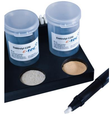
Gefahrstofffreie Polierflüssigkeit C250 für hervorragende Schlißbilder