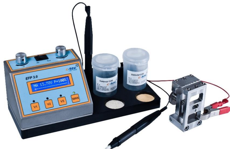
Elektronische Feinpoliereinheit EFP 3.0, hier mit Probenhalter Screwfix und nachrüstbarer Krokodilklemme

Fehlerhaft eingestellte Crimpprozesse können zu erheblichen Schäden oder Ausfällen von Crimpverbindungen führen. Aufgrund der Produkthaftung des Kabelbaumherstellers können teure Schadensersatzansprüche und Imageverlust die Folge sein. Zur Prüfung von Qualitätsanforderungen empfehlen wir eine Stichprobenprüfung mit Schliffbild. Das Feinpoliergerät EFP3.0 ermöglicht ein schnelles, reproduzierbares und zuverlässiges Polieren von geschnittenen und geschliffenen Crimpverbindungen. Nach dem Polieren kann das Schliffbild vermessen und dokumentiert werden. Die von uns beim Polieren der Schliffe eingesetzten Elektrolyte sind entweder ganz ohne Gefahrstoffe konzipiert oder für Spezialanwendungen nur mit einem geringen Gefahrstoffanteil versehen. Das elektronische Feinpoliersystem EFP 3.0 ist ein weiterer Baustein in der Produktfamilie Microlab, um die Schliffbilderstellung noch effektiver, sicherer und bedienerfreundlicher zu gestalten.