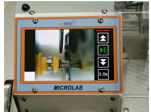
Schnittkontrolle mit optionaler Visual Cut Camera (VCS)