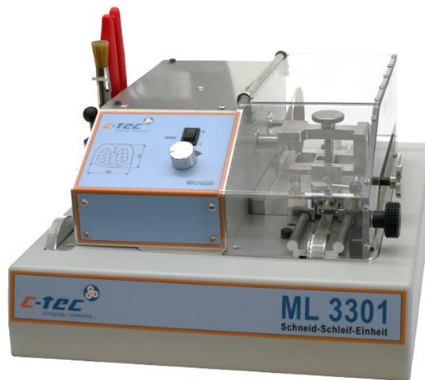
Schneid- und Schleifeinheit ML 3301 integriert in ein Aluminium-Gehäuse

Mit der Schneid- und Schleifeinheit ML 3301 können Crimpverbindungen exakt getrennt und geschliffen werden. Das Metall-Sägeblatt ermöglicht einen präzisen Schnitt.