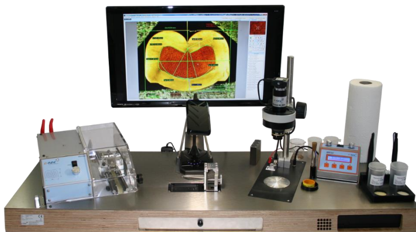
Das Microlab ML 3600 mit integriertem Mini-PC

Tischlabor zur Erstellung von Schliffbildern von gecrimpten Kontakten