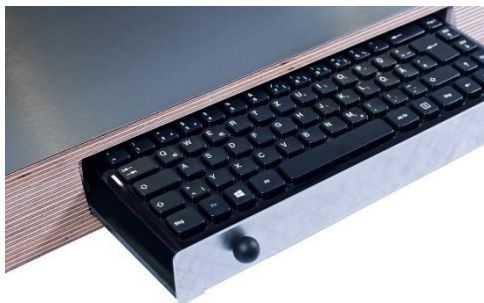
Front-Schublade mit Tastatur